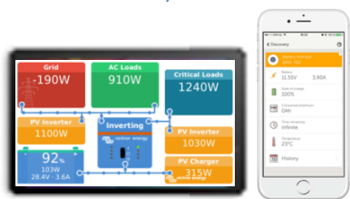
Visualisierung und Bedienung zusätzlich per Tablet, Portal und APP