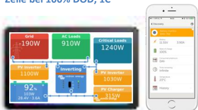
Visualisierung und Bedienung zusätzlich per Tablet, Portal und APP